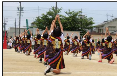
【6年 侍 前田利家 野田の舞】