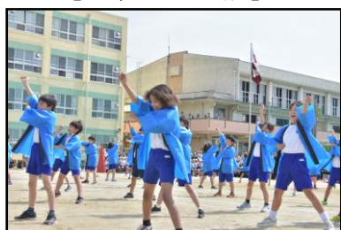
【4年生 ロックソーラン】